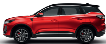
Красный с черной крышей