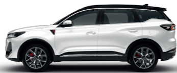
Белый с черной крышей